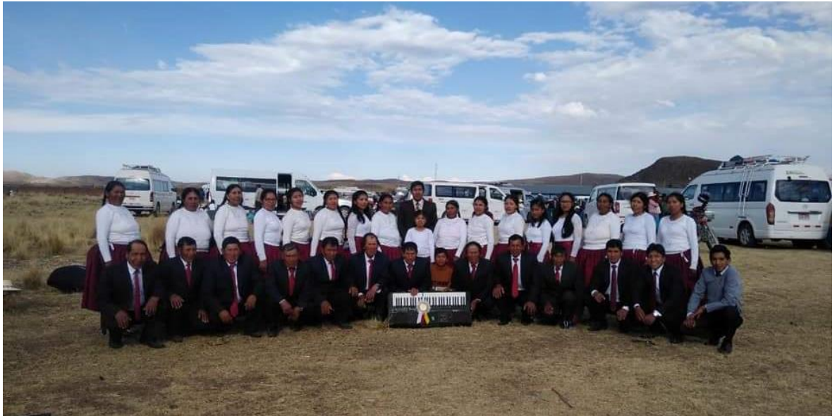
Capacitación y coordinación de líderes para el festival 2022