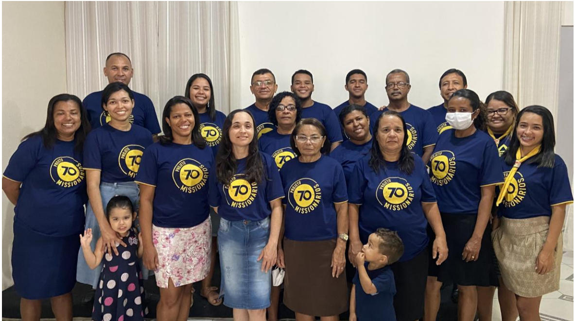
Miembros de la iglesia de Santa María el sábado de tarde