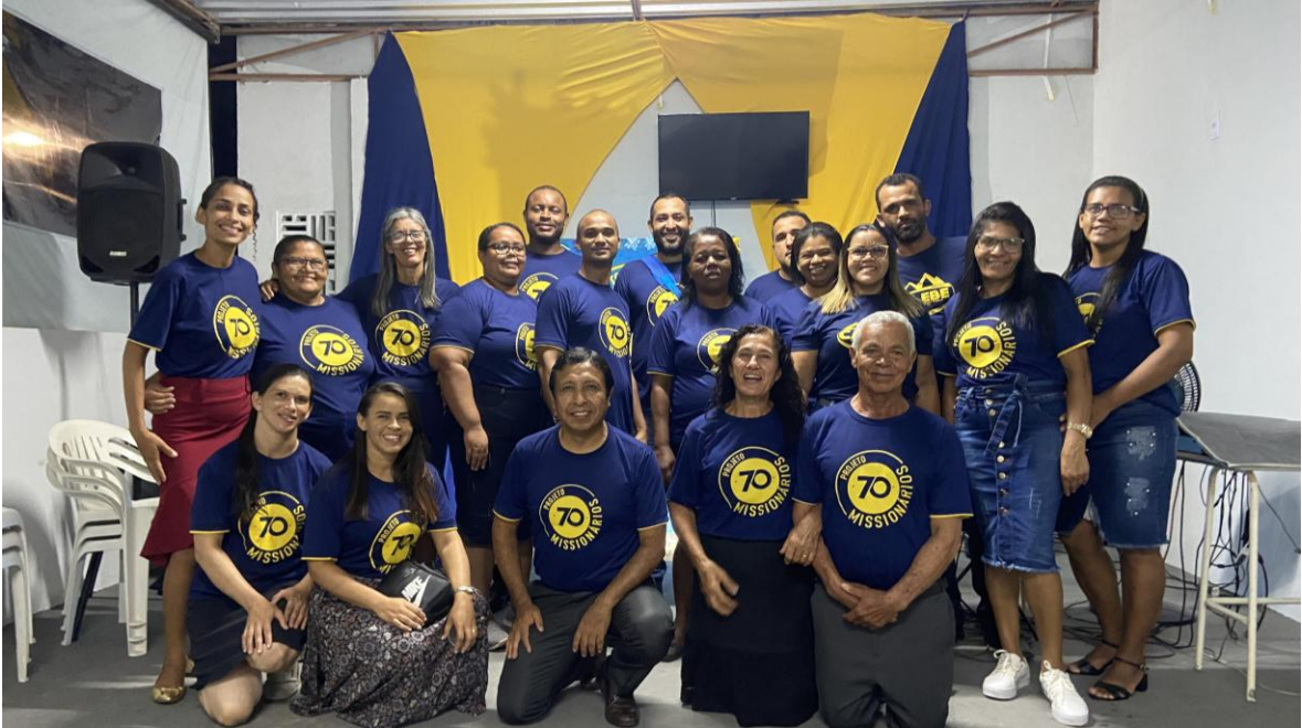
Iglesia de Santa María el sábado de tarde