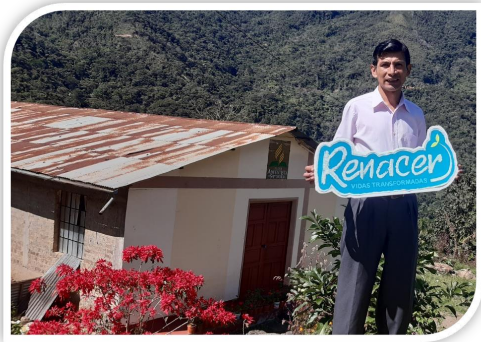
Templo antiguo de San Juan del Oro, Central del Distrito

Esta es la fachada que quedó en el año 2022, foto con nuestras hermanas diaconizas y amigas de la familia.