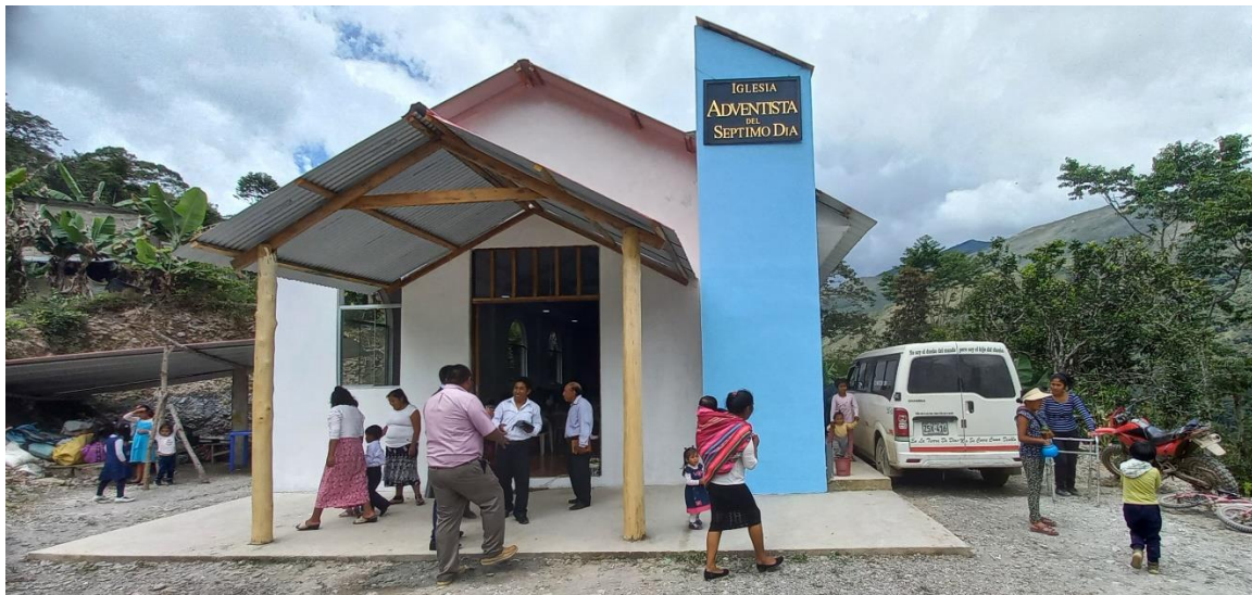
Fachada de Templo “Purumpata”