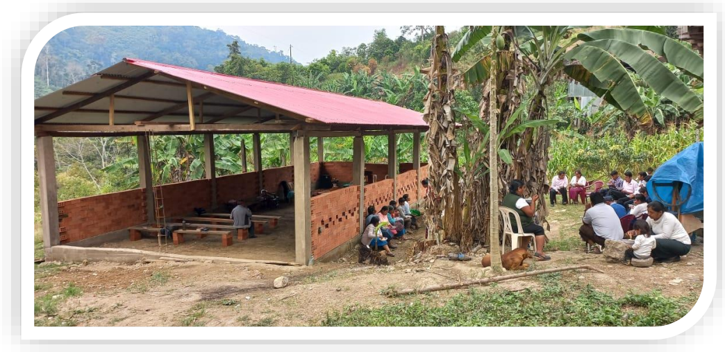
Templo en construcción “Monte Sinaí”, reunión con hermanos de la zona y visitas, año 2021