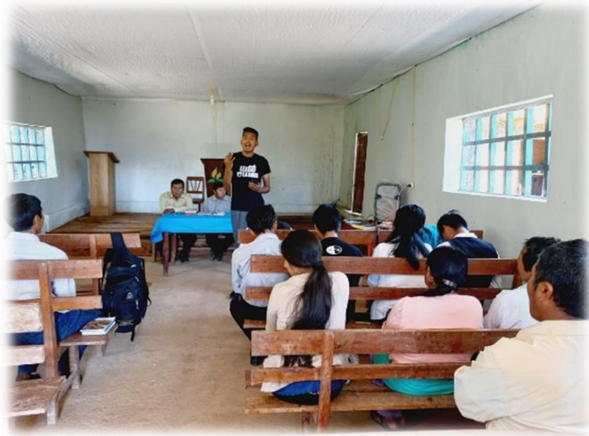
Grupo “Pampas de Moho” también reabierto después de 20 años y reaperturado