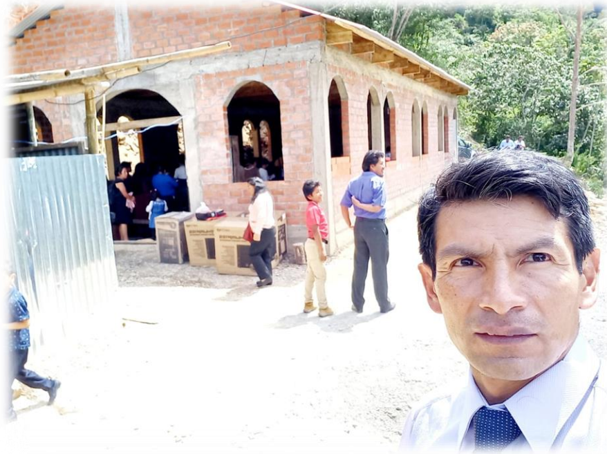
Templo Yanamayo, con infraestructura Nueva