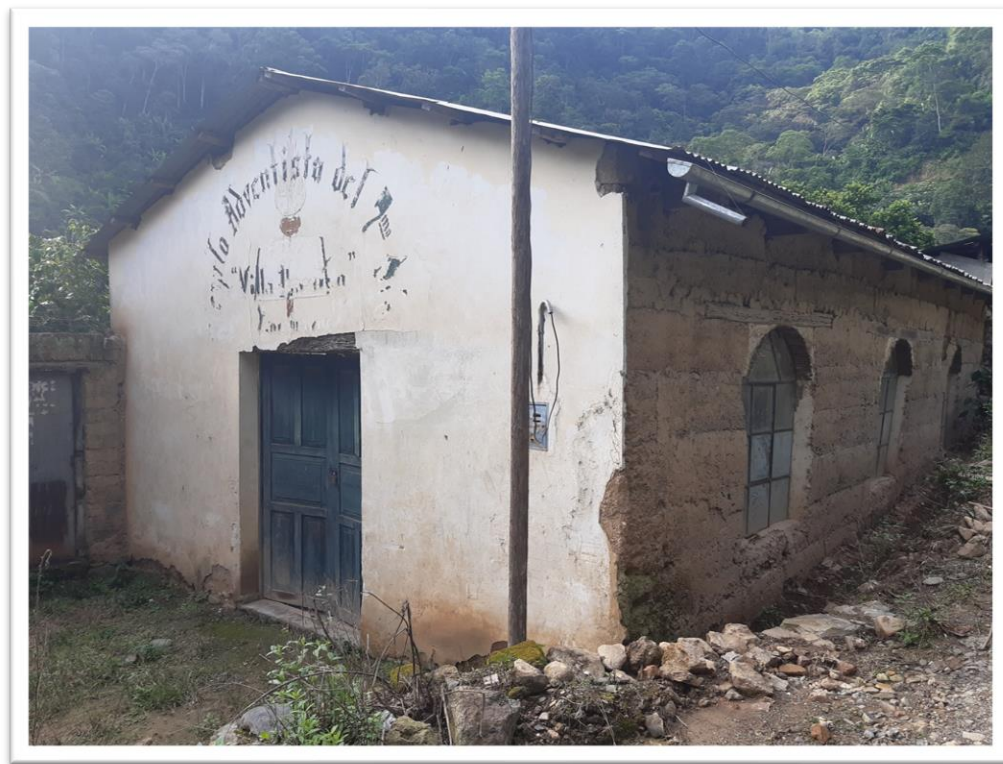
Templo de Yanamayo, estaba en mal estado

El siguiente templo que se construyó fue uno cercano, que se ubicaba a 25 minutos de la iglesia central, esta iglesia llamada “Yanamayo” vio con alegría como la hermandad quedaba muy entusiasmada y como la obra se fortalecía, así que si otros podían con pocos recursos, porque ellos no, el problema era el lugar del templo que era muy reducido, además de tener un poco de complicaciones con los vecinos, se oró mucho, para empezar de cero, sin embargo las condiciones se dieron después de la espera, paciencia pero firmeza de nuestros hermanos, así que en la ladera del extremo del centro poblado cruzando el ríos “Tambopata” se logró conseguir un lugar, y con la misma fe, esfuerzo, y recorrido de nuestros hermanos en cada iglesia, y de la población se logró un nuevo templo.