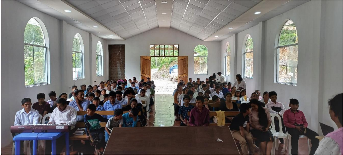
Interior del templo “Purumpata” en concentración zonal

De esta manera la iglesia central del distrito quedo desafiada, así que no podía quedar atrás, con el trabajo realizado así que también se soñó, con un desafío semejante, sin embargo era la iglesia central no tenía que ser cualquier templo ni Rústico moderno ni mediano, así que había un hermano muy entusiasta, y gestor, sin embargo era la iglesia y sus dirigentes la que al final propusieran un templo grande, moderno y atractivo.