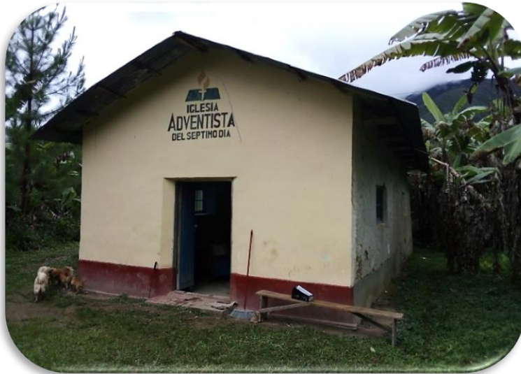
Templo antiguo “Purumpata”

Sin embargo, esa fortaleza, era la única ventaja, porque el centro poblado a pesar de tener alguna minera cerca, se tenía que trabajar en la: unidad, en el proyecto mismo y el esfuerzo. Pero la unidad, el esfuerzo, local de los hermanos y el aporte de la iglesia distrital hizo realidad este sueño de superar ya los trabajos anteriores, así que al final se llegó a inaugurar en el campamento en la cual ellos mismos eran anfitriones. (año 2021)