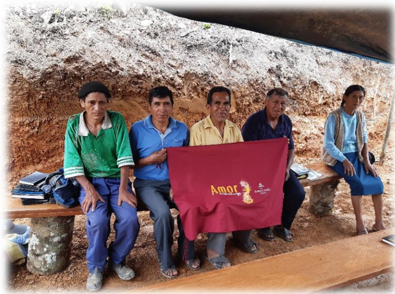
Local de reunión y plantío previo a Semana Santa 2021