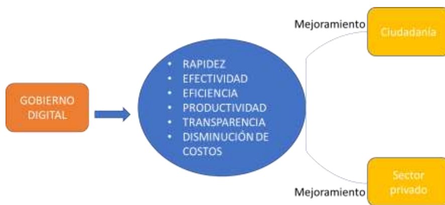
Beneficios de la tecnología en el sector público

Nota. Beneficios de la implementación de tecnología en el sector público adaptado de Competitividad digital