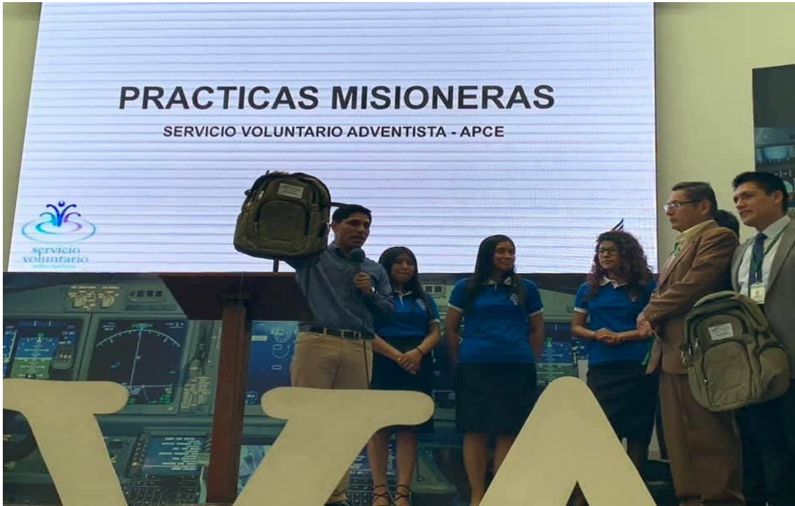
Practicas Misioneras –SVA