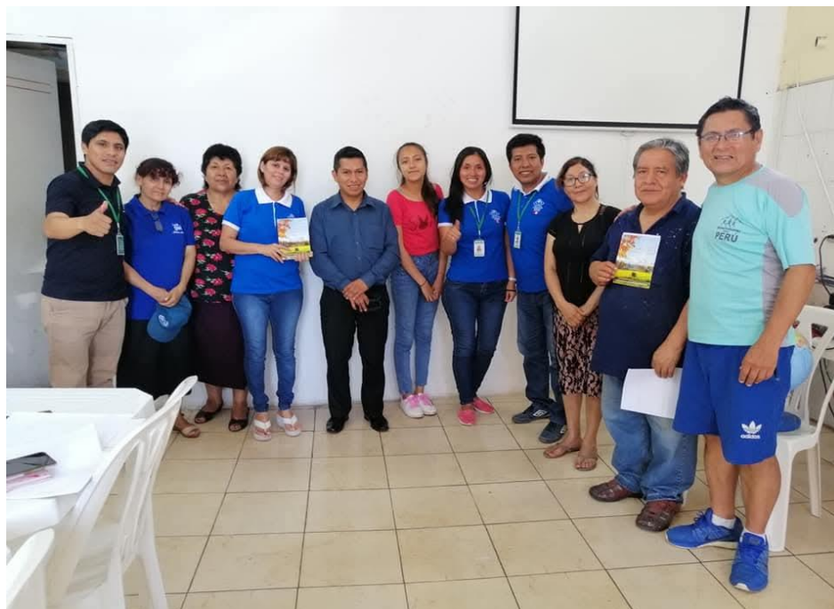
Centro de Influenza – Atención médica