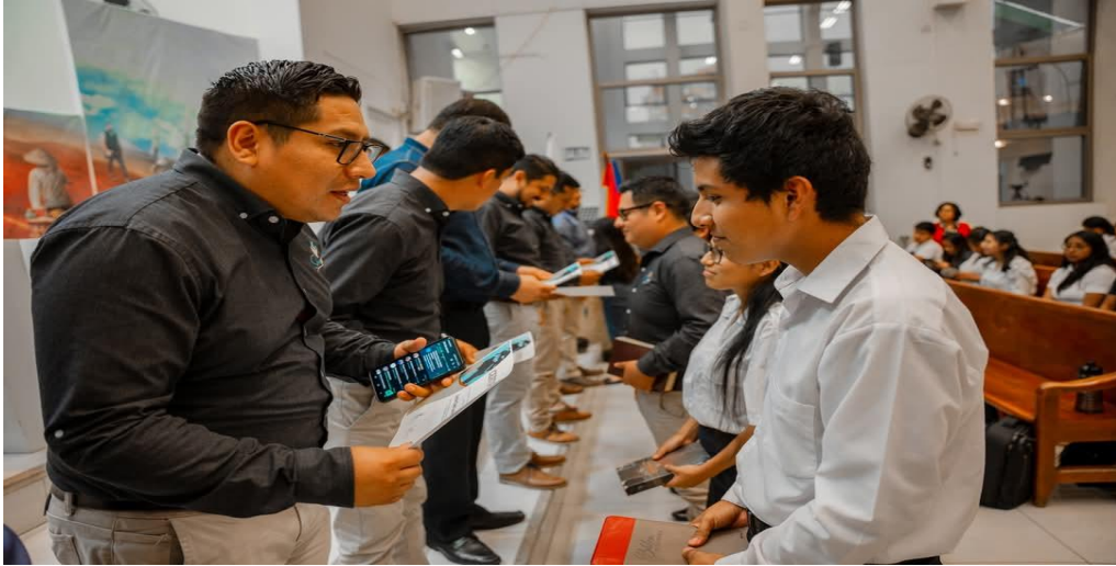
Graduados 2025 Región 3