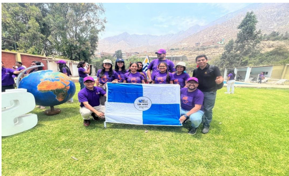
Graduados Grupo N° Región 3