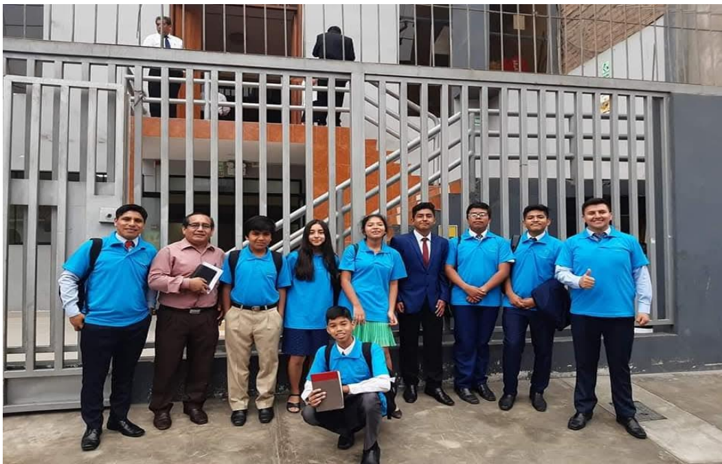
Grupo de Misioneros del Colegio El Buen Pastor de Canto Rey “School in Mission”