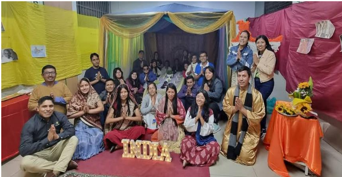
Talleres - SVA