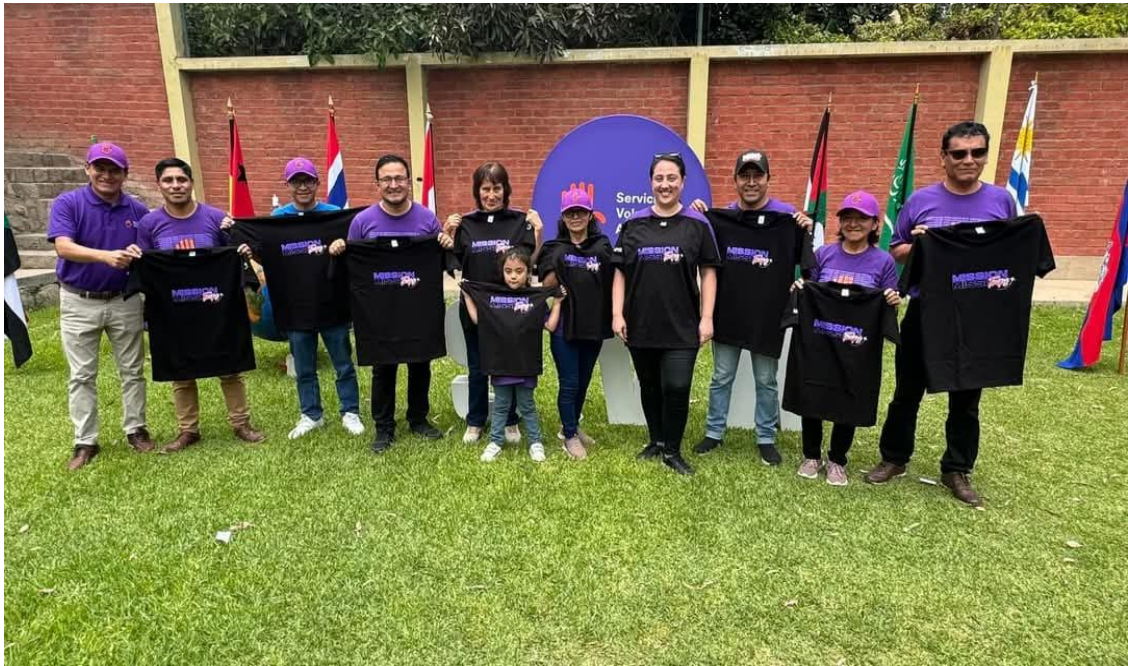
Reconocimiento y consagración a coordinadores 2024 – APCE