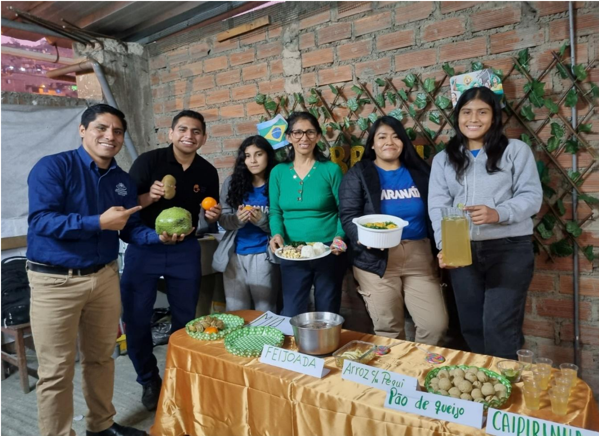
Viaje Para realizar una campaña de Evangelismo Cajamarca – MISIÓN TRIP