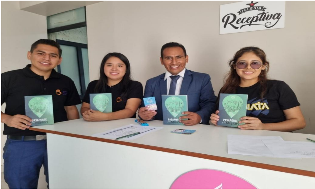
Libro de estudio SAV “ Pasaporte para la Misión”