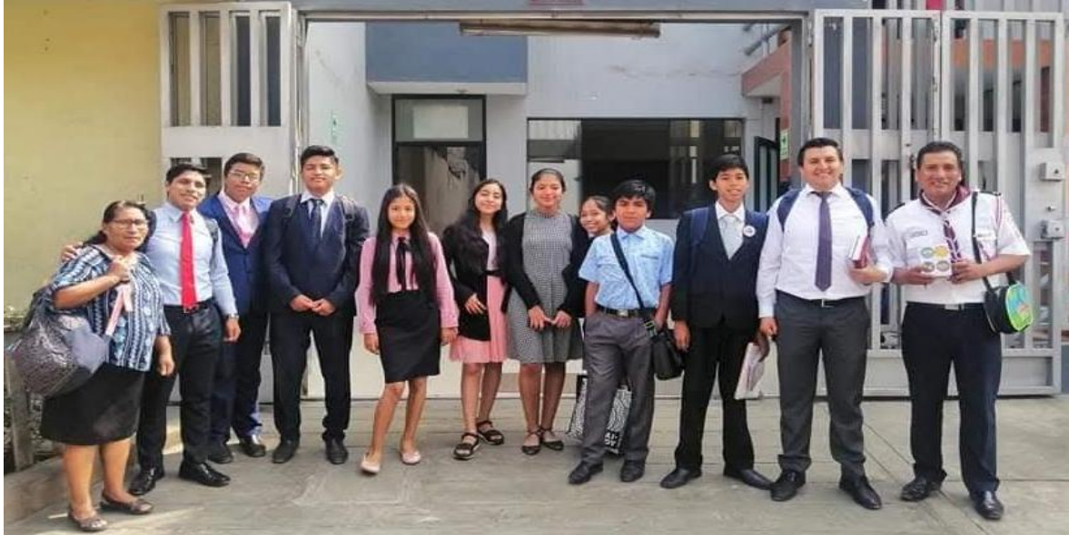
Grupo de Misioneros: Unidos en oración, listos para llevar la misión en las tardes misioneras.