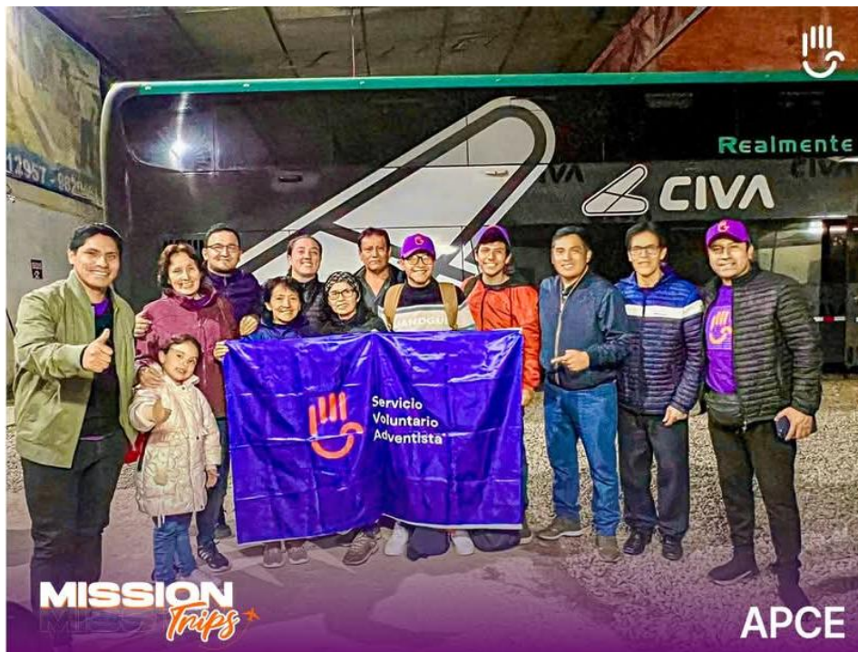
Visitas Misioneras Cajamarca