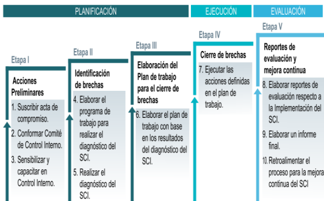
Figura 2. Modelo de implementación del SCI.

Según la Contraloría (2017, P. 09), las entidades inician o complementan su implementación del SCI en concordancia al siguiente modelo de implementación, viendo en qué etapa y fase se encuentran.