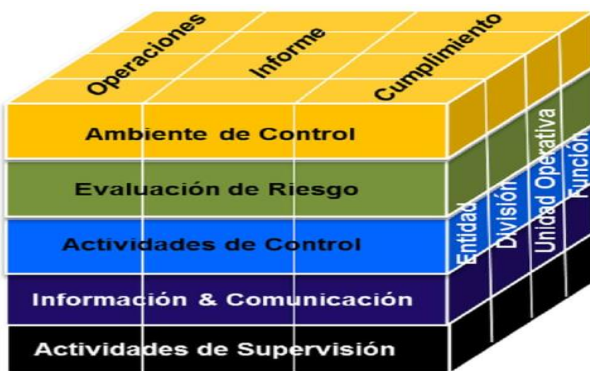
Figura 1. Componentes del control interno.

Goyena & Fallis (2019), manifiesta que el control interno es un proceso realizado por el titular de la organización y demás servidores de una Institución, con el objeto de proporcionar una seguridad oportuna sobre el cumplimiento de los objetivos institucionales (p.08 ).