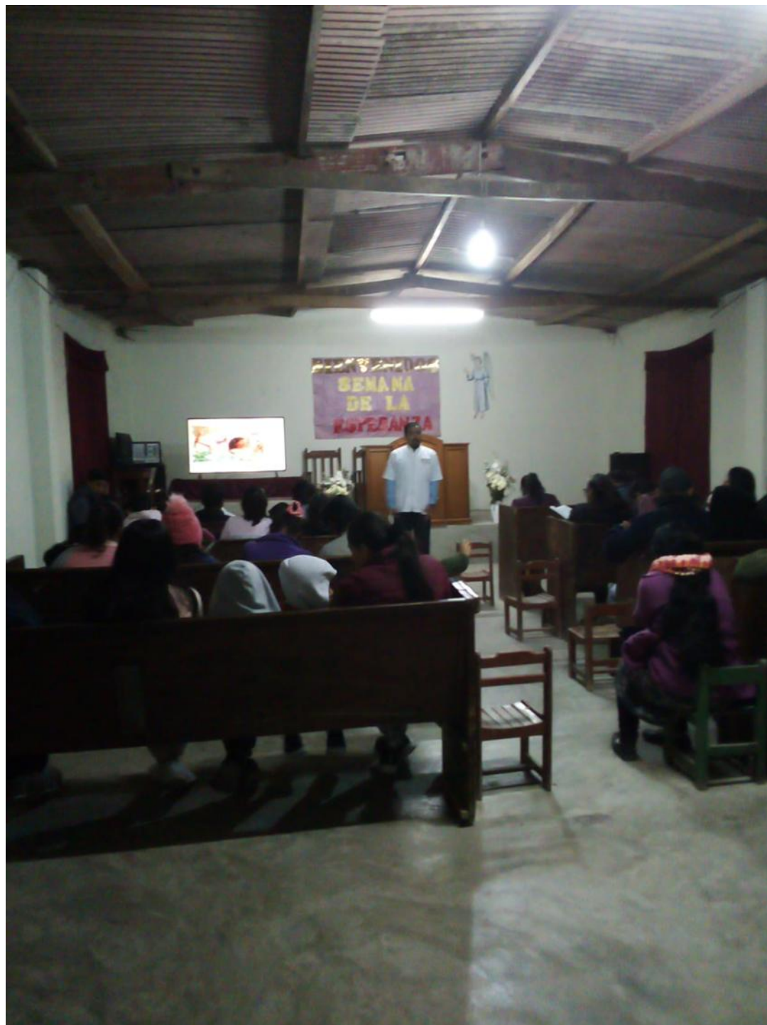
Anexo 3.3. Foto de la campaña de evangelismo