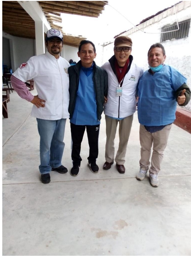
Anexo 2.2. Foto de personal médico