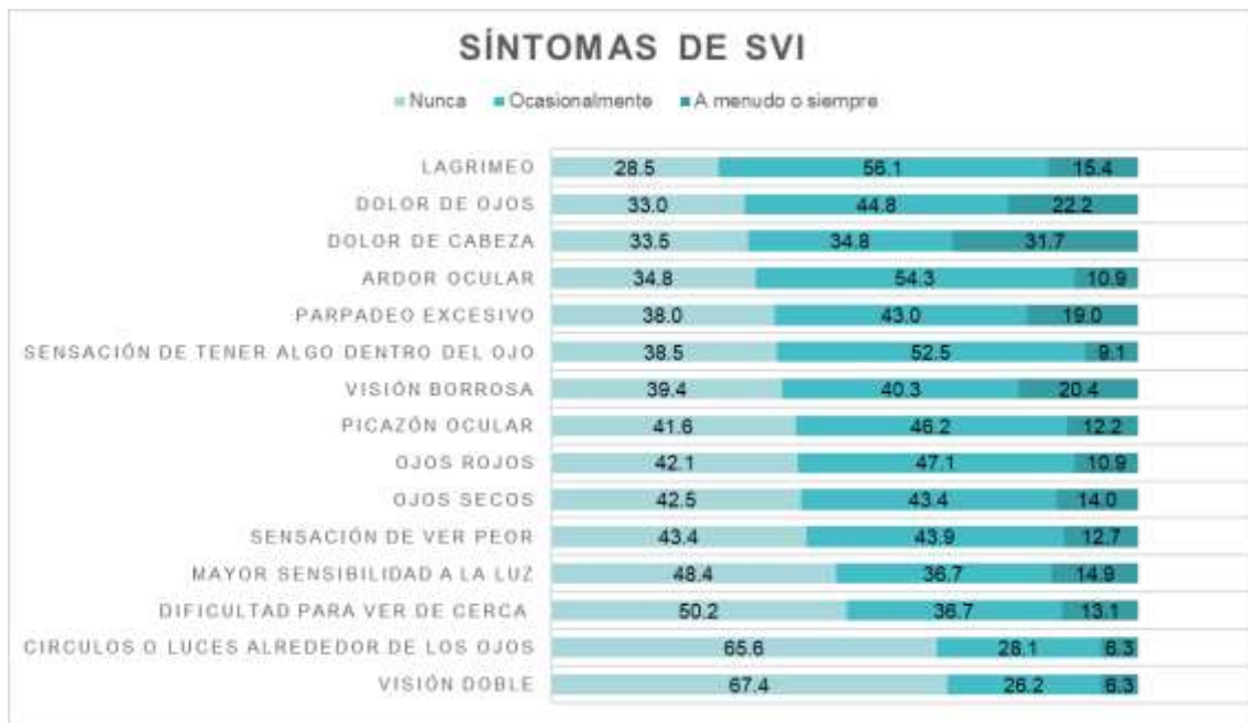
Figura 1. Frecuencia de síntomas de SVI (n=221).

Nota: * \chi^2 . ** razón de prevalencia calculada con regresión de Poisson